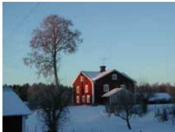
Blick zum Nachbarn